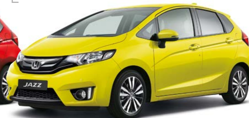
Attract Yellow Pearl