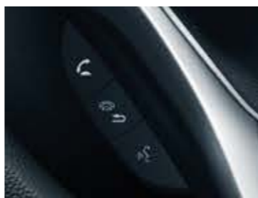
BLUETOOTH™ TELEFON-KIHANGOSÍTÓ (HFT) Δ

Opcionális: Honda CONNECT Garmin navigációval és CD-lejátszóval Ülésfűtés Cápauszonyserű antenna