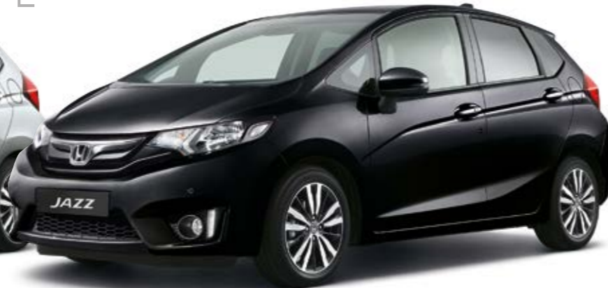
Crystal Black Pearl