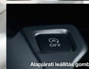
Alapjárat leállítás gomb