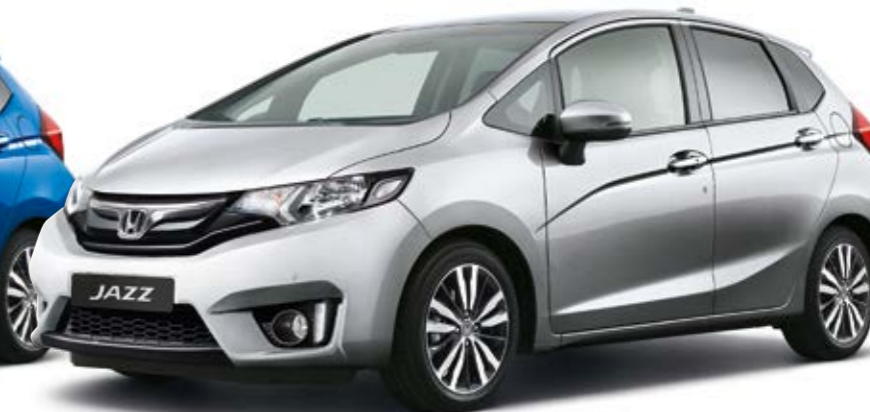
Alabaster Silver Metallic