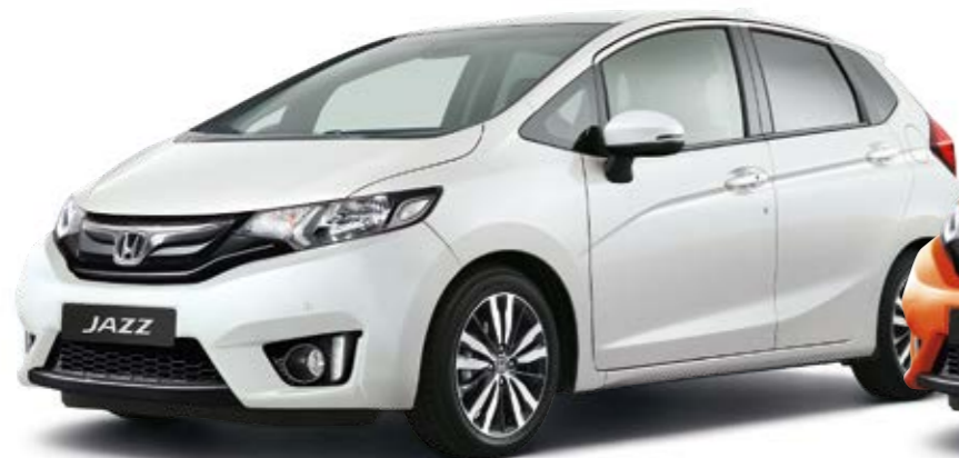
White Orchid Pearl

A Jazz híresen sokoldalú, nem lehet tehát az sem meglepő, hogy rengeteg színből lehet választani. Melyik illik legjobban a személyiségéhez?