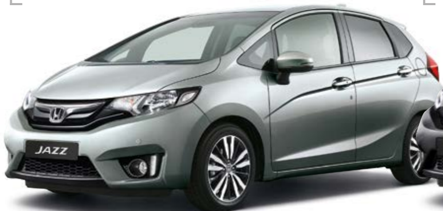
Tinted Silver Metallic