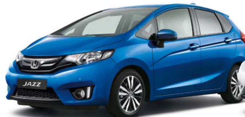
Brilliant Sporty Blue Metallic