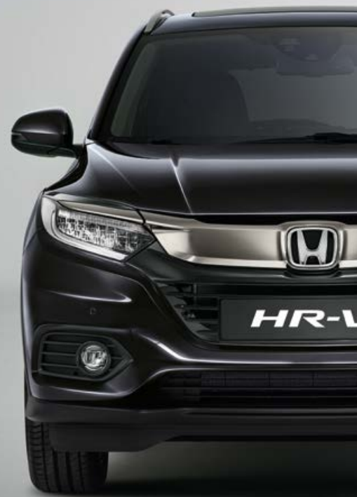
RUSE BLACK METALLIC