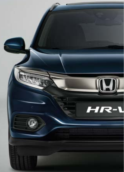
MIDNIGHT BLUE BEAM METALLIC

Színválaszték, ami nem csak jól hangzik, de nagyszerűen is néz ki. A Midnight Blue Beam Metallic-től a Platinum White Pearl-ig, széles választék várja, hogy megtalálja az egyéniségének tökéletesen megfelelőjét.