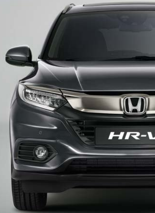
MODERN STEEL METALLIC